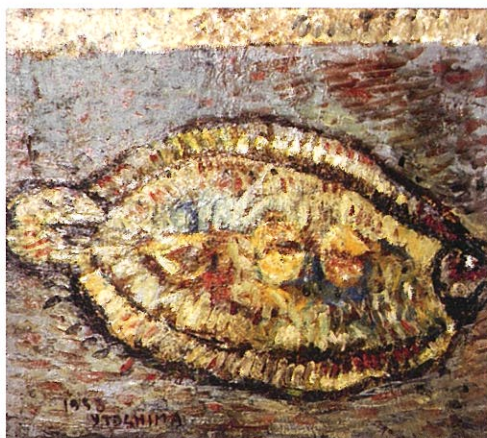
「かれいに寄せた交響楽」1953年