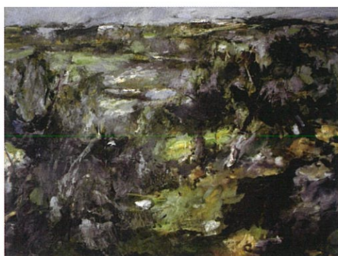
「アスナルカサル村」1975年