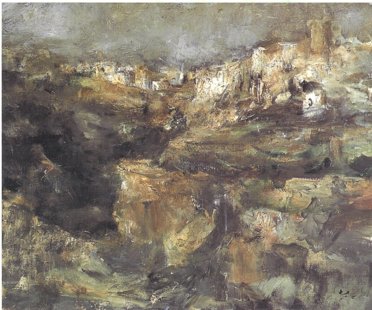
「町の眺め(アラーマ・デ・グラナダ)」 1988年

会 期：2024年 7月13日(土) — 8月18日(日) 午前9時～午後4時30分(入館は午後4時まで)