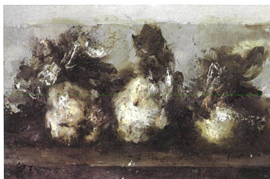
「三つのメンバージョ」1996年